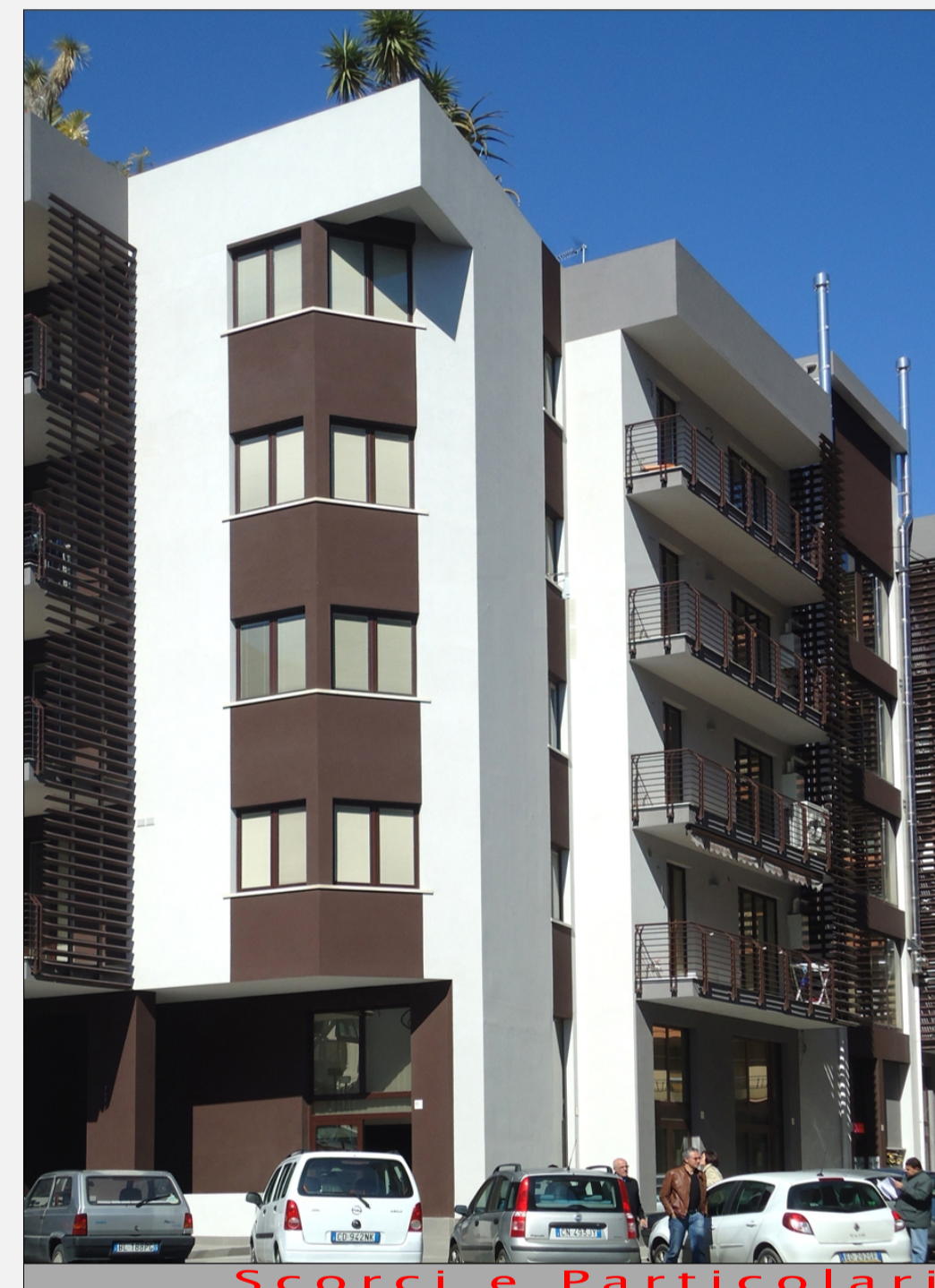
Scorci e Particolari dell'edificio realizzato