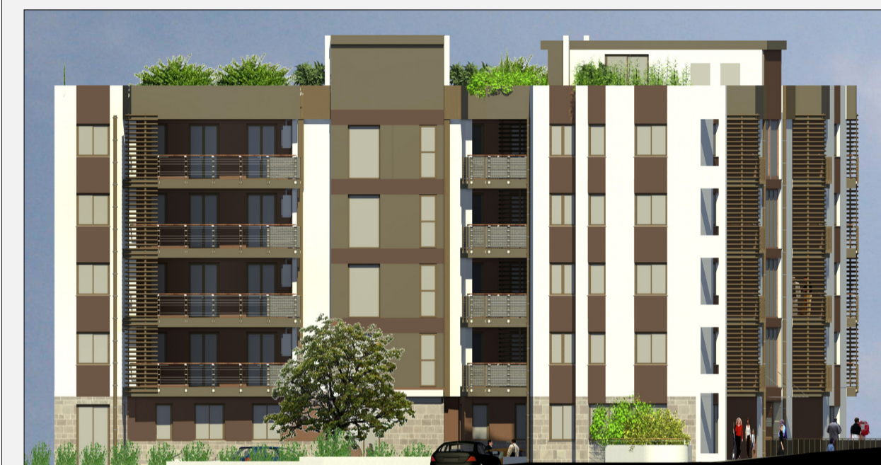
Prospetti est ed ovest